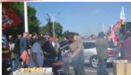
les cheminots retraités au boulot. Gare de Joué-les-Tours le 18 Mai

Au moment où ces lignes sont écrites, le 23 Juin, les cheminots en sont à leur 34 ème jour de grève, à l'appel de la CGT mais aussi de SUD-rail, UNSA, CFDT et FO. C'est historique.