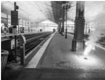
14 Mai journée sans cheminots. La Gare de Tours sans train. Plus de 400 cheminots en manifestation de la Gare de St-Pierre à celle de Tours

Aujourd'hui, le gouvernement veut livrer le fruit du travail des cheminots et des Français à des intérêts privés.