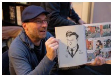
Reconnaissez-vous le personnage dessiné par Dominique Hennebaut lors d'une séance de dédicaces de la BD « Histoire de solidarité » ?