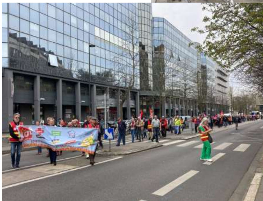
Les manifestants devant le siège de l'ARS 37