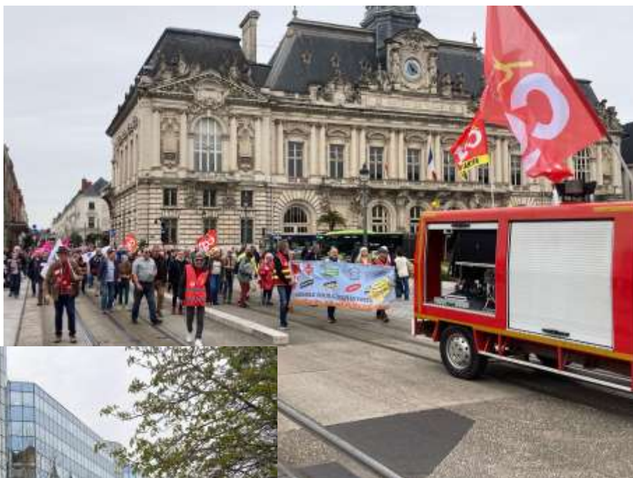
Le cortège place Jean Jaurès

Plus de 200 manifestants se sont réunis place de la Préfecture et, après l'intervention au nom de l'intersyndicale, tous se sont rendus en cortège au Champ Girault devant l'ARS 37 afin de soutenir la délégation qui était reçue et attendre sa sortie.